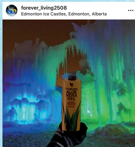
Forever Living (Edmonton, Alberta) "Look better. Feel better. 100% inner leaf aloe vera." #Aloearoundtheworld